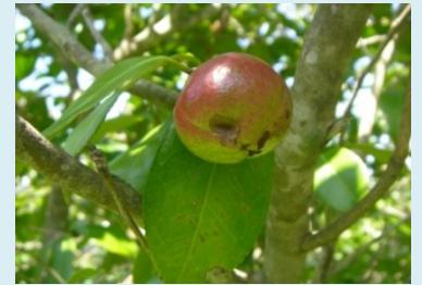
摘み取り前のツバキ種子

今回、3D計測班は7月下旬に長崎県の五島列島にてヤブツバキの樹木形状計測を行って来ました。五島にはヤブツバキが多く自生し、古くから食用のツバキ油が作られ、かつては全国一の生産量を誇り、『東の大島、西の五島』と並び称されるほどのツバキの自生地として名高い列島です。五島ツバキといえは、有名化粧品メーカーのシャンプーにも使用されているブランド植物になります。