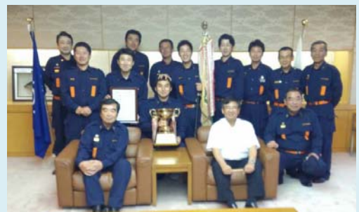
富士宮市長へ表敬訪問 H25.8.27

これまで約1年間訓練に励み、良い時も悪い時も皆で話し合いを重ね、どこにも負けないチームが出来上がりました。