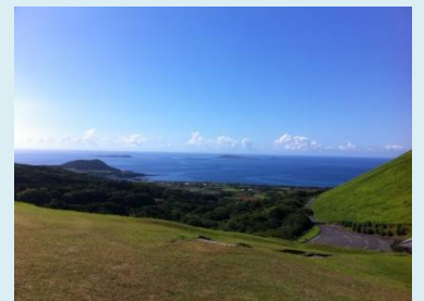
五島福江空港付近 鬼岳から望む東シナ海

五島列島はツバキ以外にも牛(肉牛)やお茶の生産が盛んで、観光面では恵まれた自然や海水浴を目的に訪れる方も多いようです。また、島には多くの教会が存在し観光スポットの一つとしても注目されています。