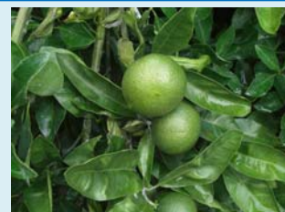
摘果の時期のみかん まだ青く大きさが3～6cm程度

用意する物・・・摘果みかん（果汁換算）：200ml 砂糖（グラニュー糖）：80～120g（量はお好みで） しぼり器、大きめの鍋、ガーゼ、