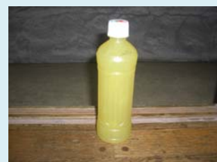
摘果ジュース 市販のみかんジュースより色が薄い黄色になります

摘果とは・・・大きくて味のよい果実を毎年生産するために、結実した果実の一部を小さいうちに間引くこと。摘果することによって、残した果実に養分がいくようになって良い品質の物が出来る。