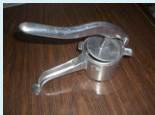
しぼり器 手で握ることでしぼることが出来ます

手軽に作れておいしい、しかもビタミンCがたくさん入ったジュースです。もし、摘果みかんを手に入れる機会がありましたら、是非お試しください。