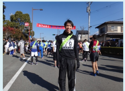
初駅伝の舞台に緊張してます；(笑)

沿道で声援を下さいました多くの方、各中継点でドリンク等のサービスをされていた方々、本当にありがとうございました！！