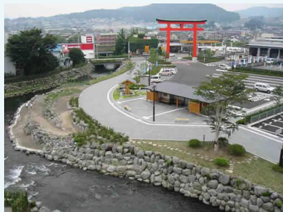
富士山せせらぎ広場

それぞれの地域には、昔からの守るべき風習や景観などがありますが、ワークショップなどを行い地域の皆様の意見を聞きながら良い『まちづくり』を目指しています。