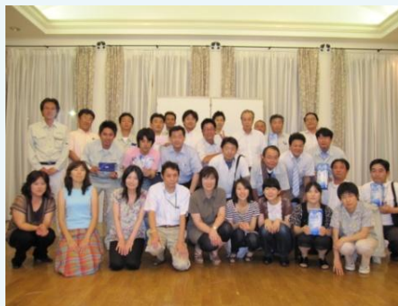
7月親睦会集合写真