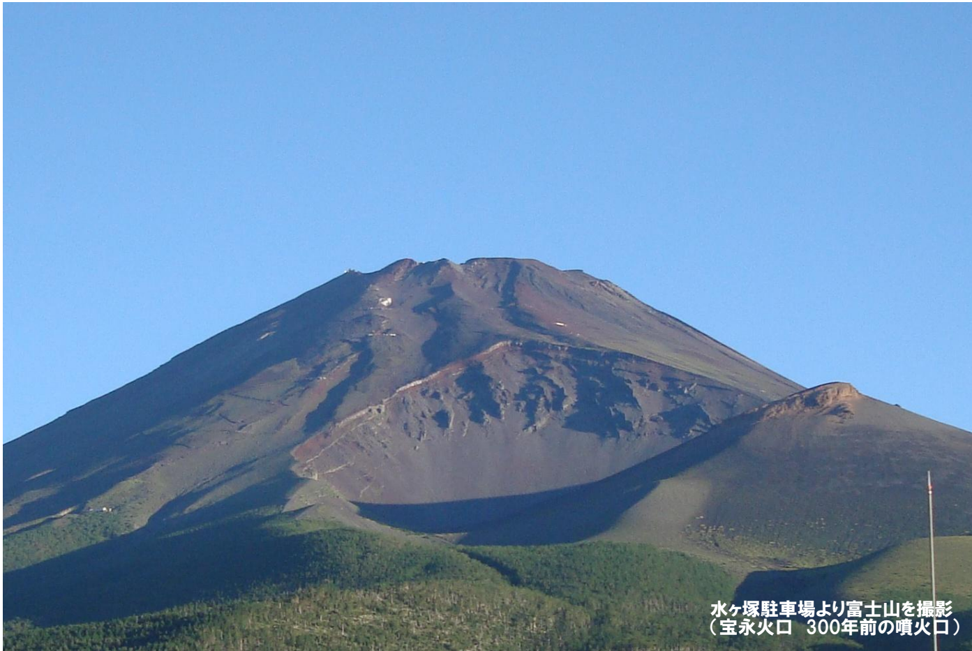
水ヶ塚駐車場より富士山を撮影 (宝永火口 300年前の噴火口)