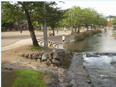
神田川ふれあい広場