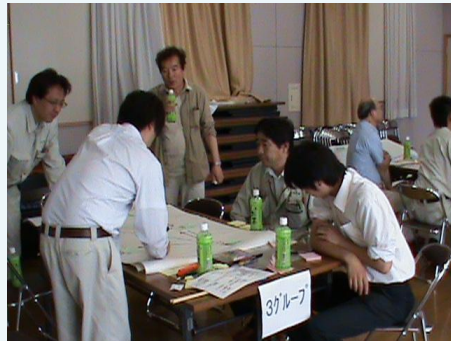
6月ワークショップの様子